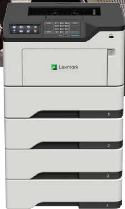
M3250 mit optionalen Fächern