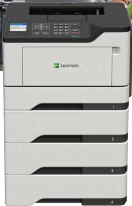
M1246 mit optionalen Fächern