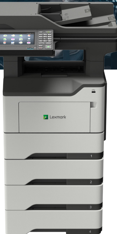
XM3250 mit optionalen Fächern

Zuverlässigkeit. Sicherheit. Produktivität.